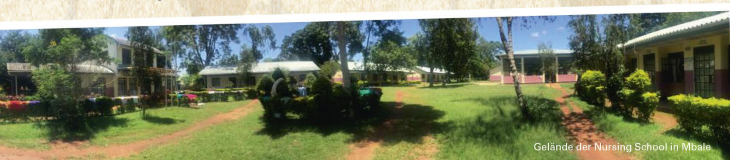
Gelände der Nursing School in Mbale