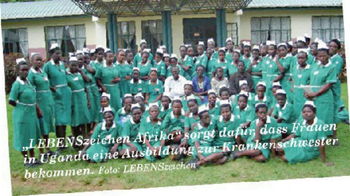
„LEBENSzeichen Afrika“ sorgt dafür, dass Frauen in Uganda eine Ausbildung zur Krankenschwester bekommen.